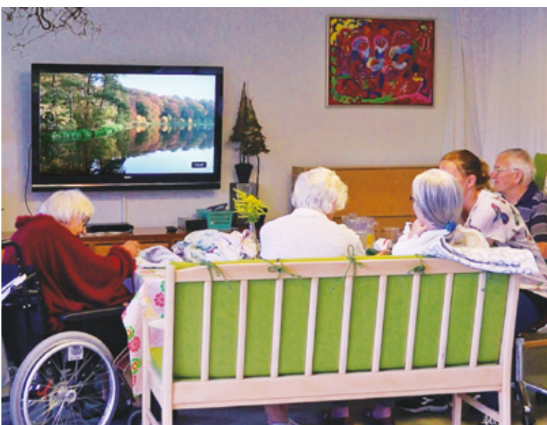
Naturfilm i opholdsrum på plejecentre - i stedet for TV-nyheder

Film med rolige livsbekræftende naturmotiver og specielt komponeret musik, skaber positive oplevelsesrejser, som virker både motiverende og inspirerende.