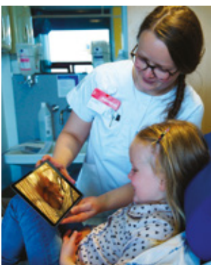
Stue, venteværelser og opholdsrum

Den specielt komponerede musik 'MusiCure' af komponist Niels Eje er fra starten skabt med henblik på at modvirke stress, angst, og smerter, samt formidle inspiration, motivation og positive oplevelser.